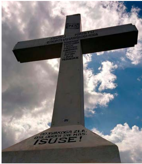
14 sett. - Festa Esaltazione della S. Croce

Questo è il piano di Dio per ciascuno di noi. Sia fatta la Tua volontà diciamo a Lui nel Padre nostro e questo solo dobbiamo dire e fare e vivere in ogni circostanza, in ogni azione della nostra vita e ci ritroveremo veri figli Suoi nel Figlio Suo Gesù! Niente di tutto ciò avverrà per magia, niente sarà gratuito né facile, ma tutto profumerà di Gesù, pur nella sofferenza e nel dolore come fu per Lui! Pace e gioia in Gesù e Maria!